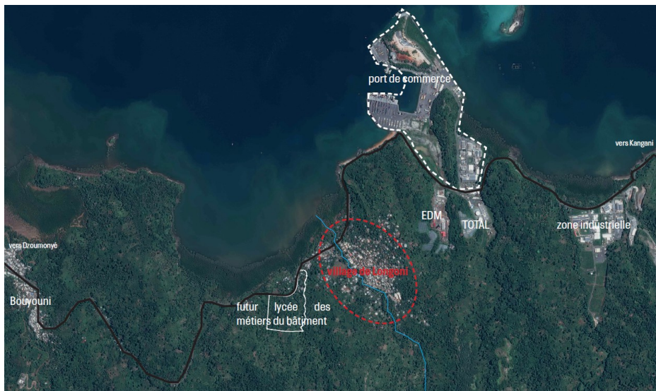
Localisation stratégique du site

Il n'existe donc pas de site en zone U ou AU sur le secteur de Longoni ou plus largement sur la commune de Koungou susceptible d'accueillir cet équipement, ce qui a donc amené à proposer le site retenu, aujourd'hui classé en zone agricole et qui fera l'objet d'un déclassement en zone constructible dans le cadre d'une déclaration d'utilité publique et de mise en compatibilité du PLU.