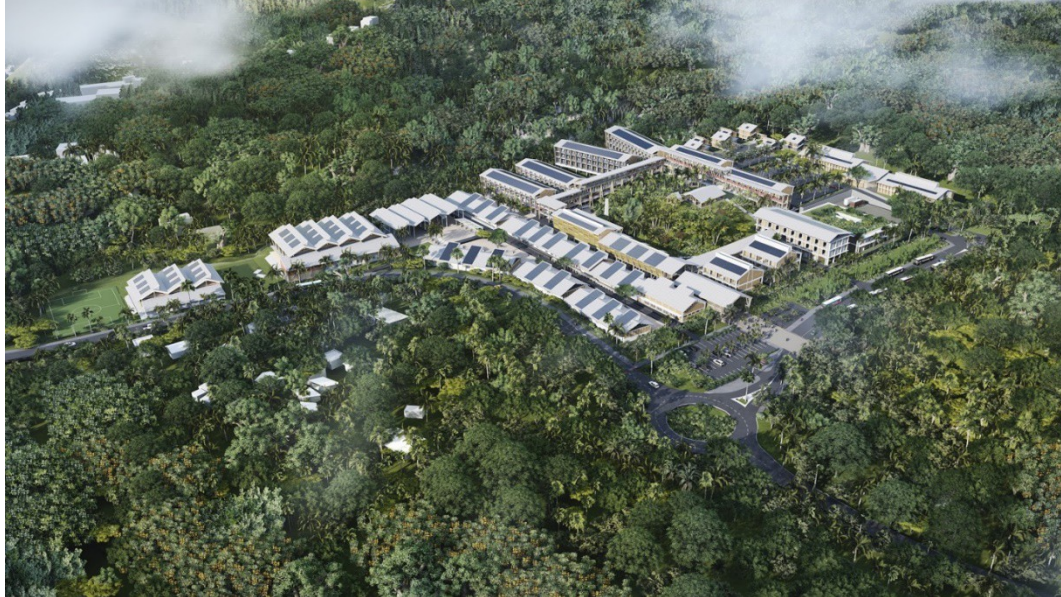
Vue avec insertion du projet

Le projet retenu est celui qui répond le mieux aux objectifs de départ, notamment en termes de fonctionnement et d'intégration dans le territoire.